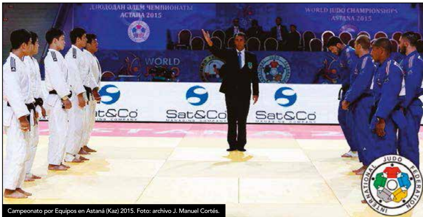
Campeonato por Equipos en Astaná (Kaz) 2015.

Su gran trayectoria como árbitro, sumada a su relación permanente con el ambiente de élite mundial, hace que hoy por hoy se encuentre con todo merecimiento en la cúspide del arbitraje.