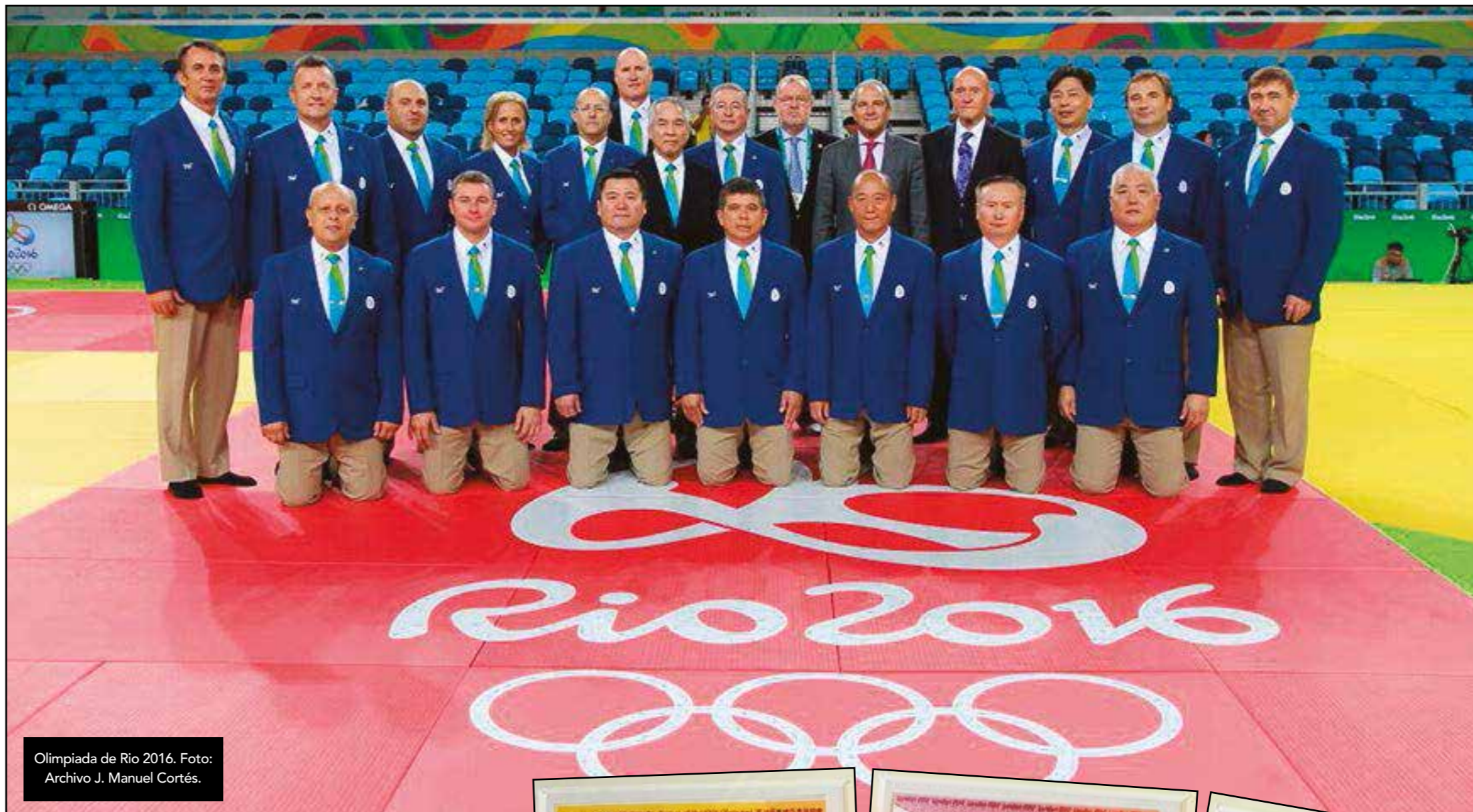
Olimpiada de Rio 2016.

Es requerido en innumerables medios por su gran conocimiento así como por la habilidad y maestría a la hora de transmitirlos. Hemos asistido a algunas de sus intervenciones y siendo concededores de este deporte, nos sigue sorprendiendo la certeza, claridad y seguridad con la que se desenvuelve y expresa.