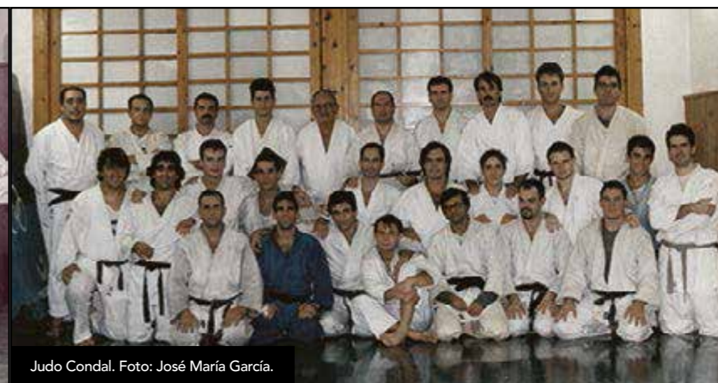
Judo Condal.