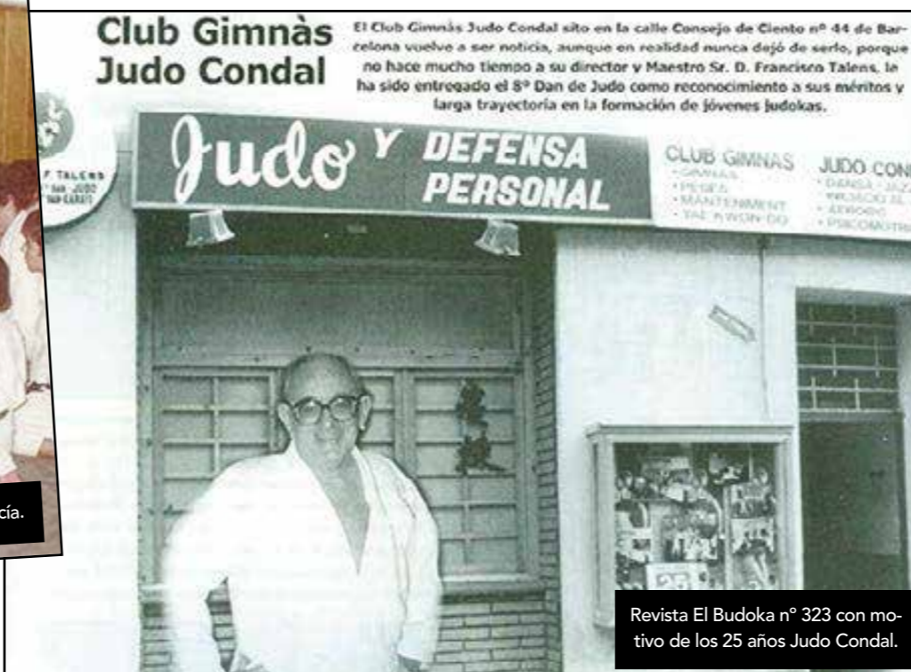
Revista El Budoka nº 323 con motivo de los 25 años Judo Condal.