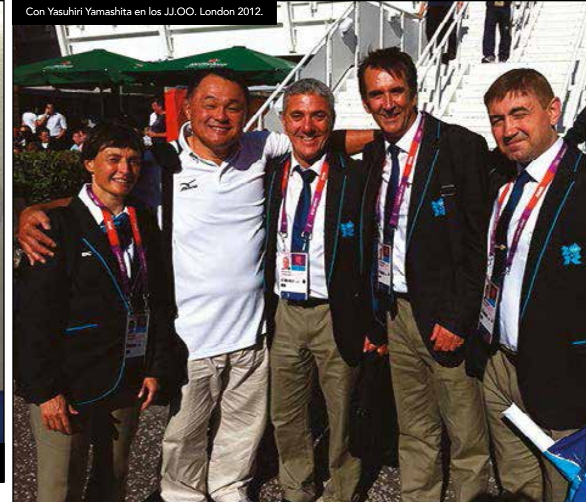
Con Yasuhiri Yamashita en los JJ.OO. London 2012.