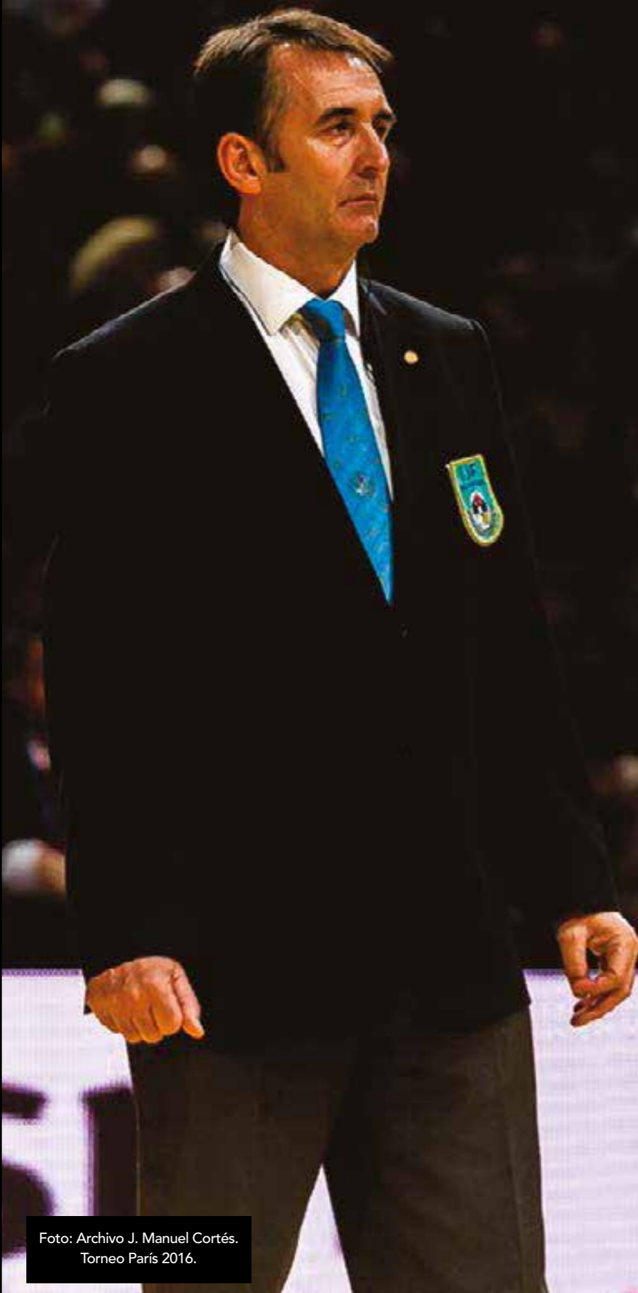
Torneo París 2016.