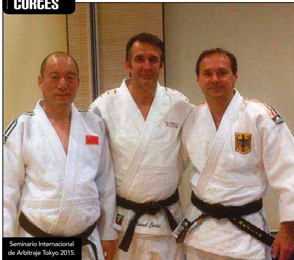
Seminario Internacional de Arbitraje Tokyo 2015.