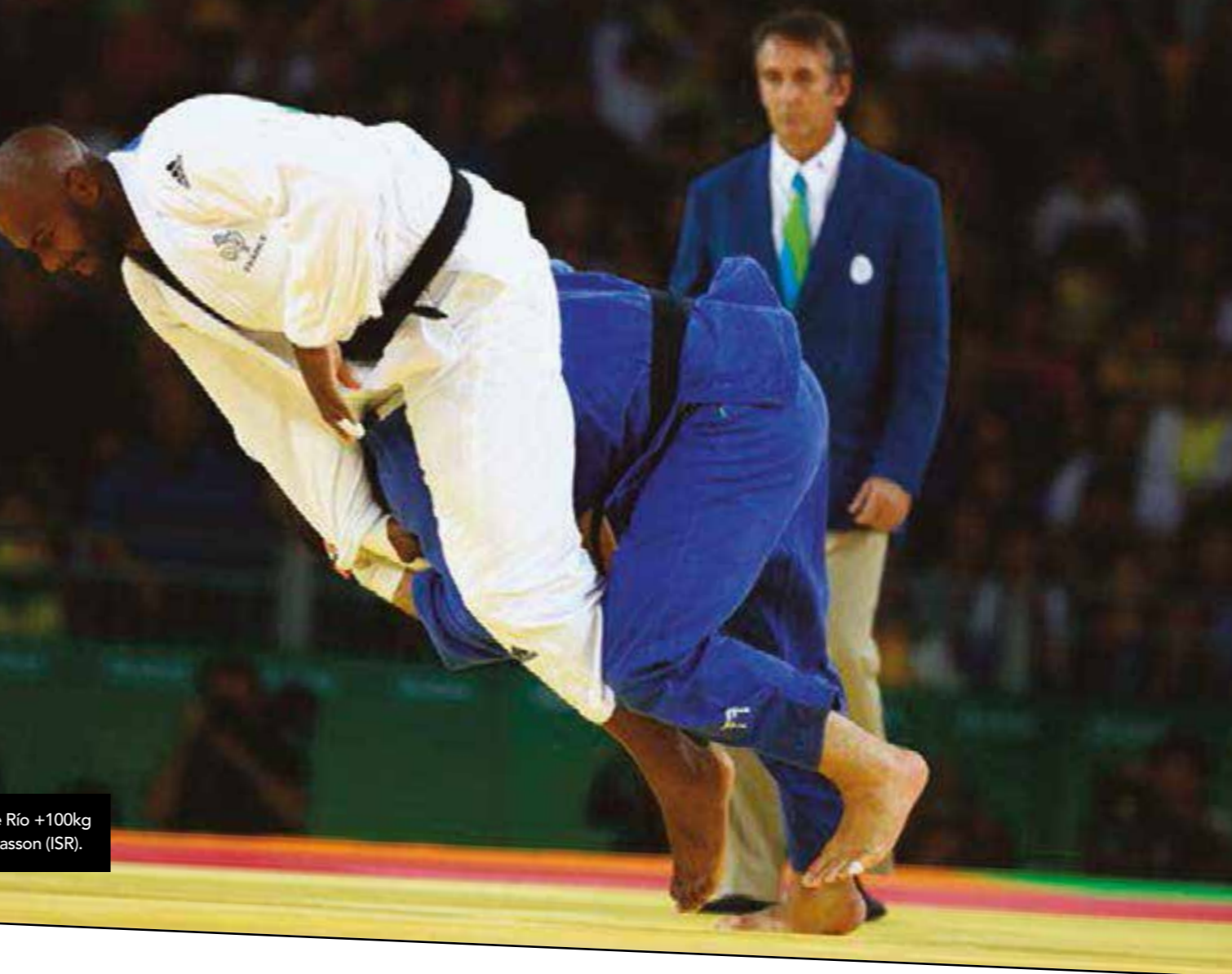
Semifinal de la Olimpiada de Río +100kg Teddy Rinner (FRA) Vs Or Sasson (ISR).

Formé parte del COOB 92 (comité organizador) durante dos años y medio. Viví los juegos del 92 intensamente desde dentro. Fue mi primer contacto con