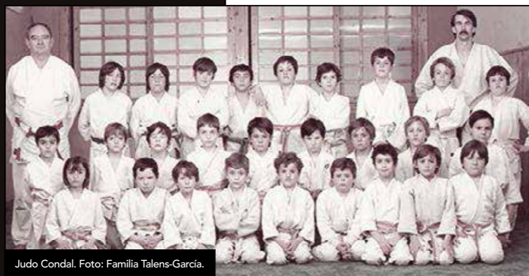
Judo Condal.