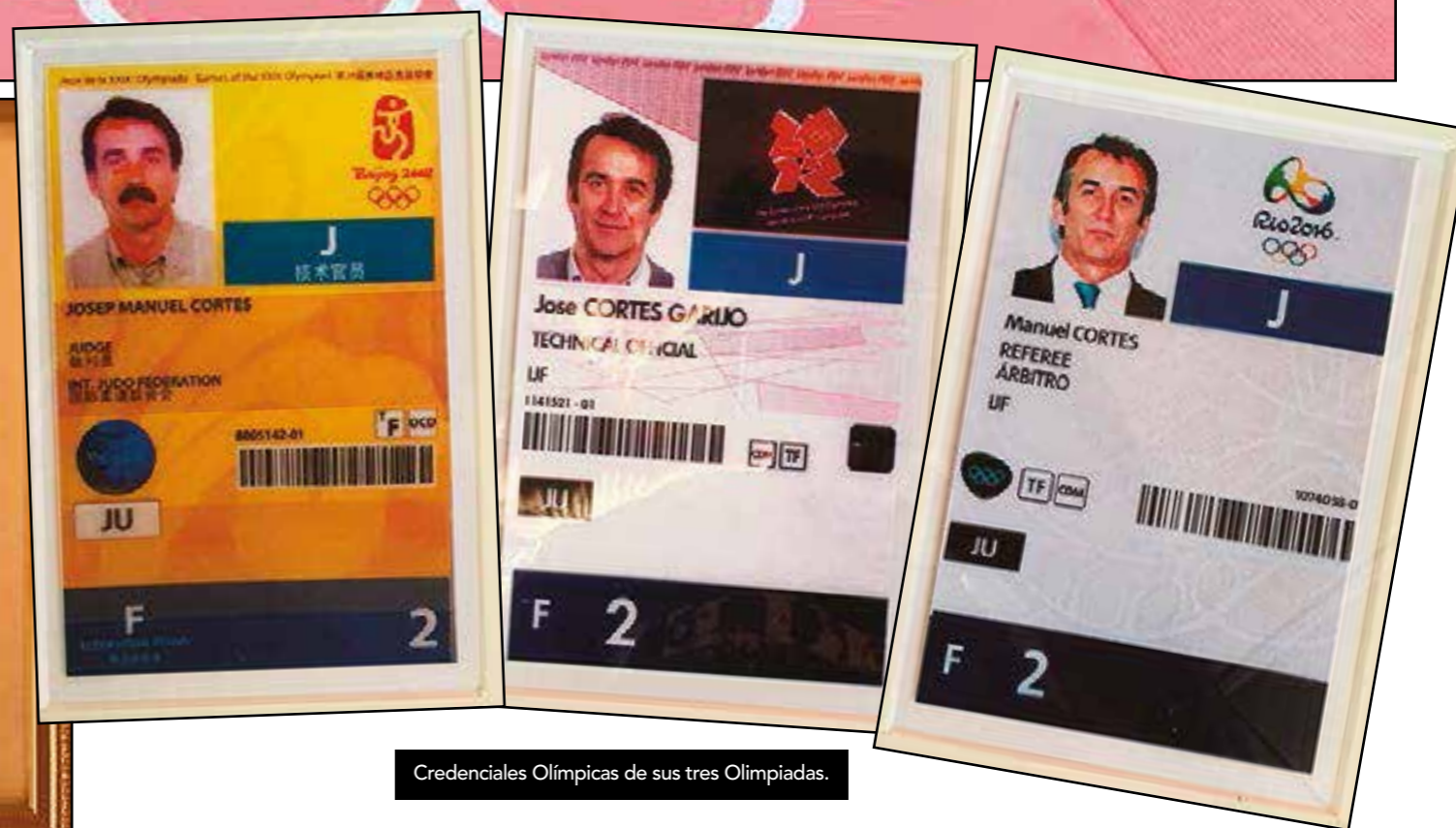
Credenciales Olímpicas de sus tres Olimpiadas.