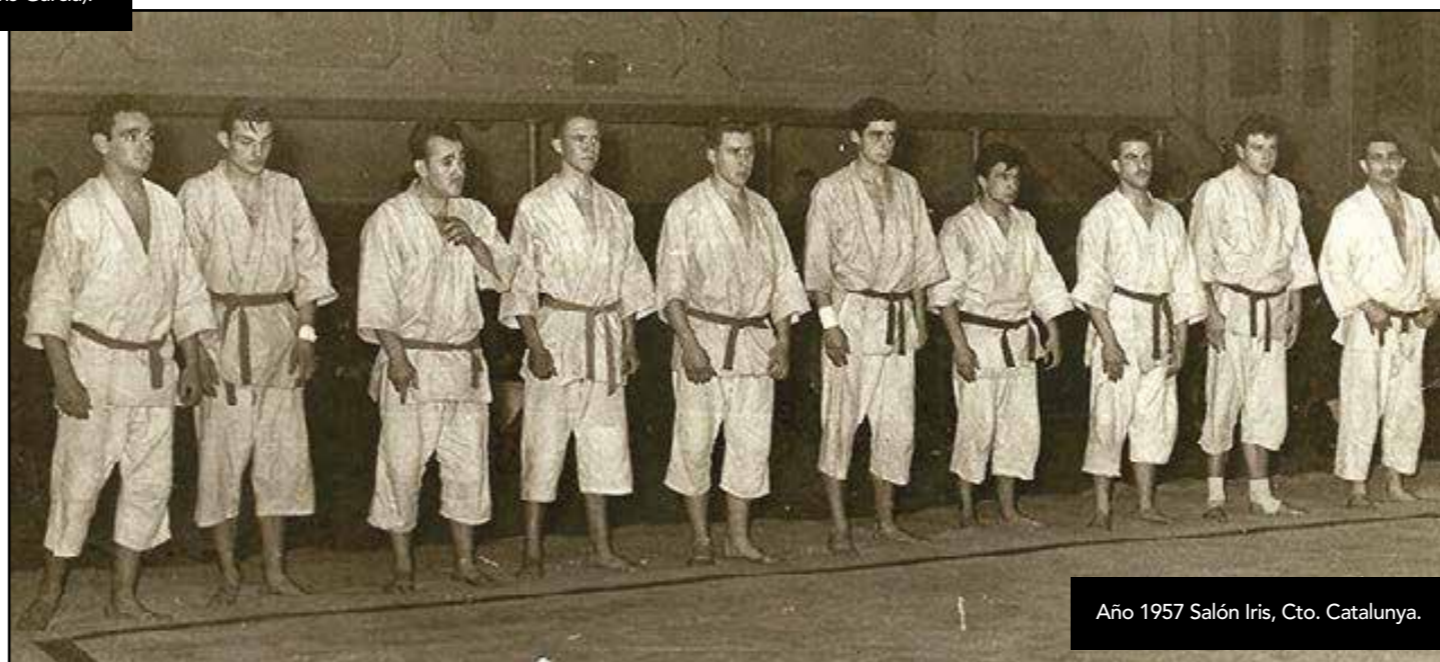
Año 1957 Salón Iris, Cto. Catalunya.