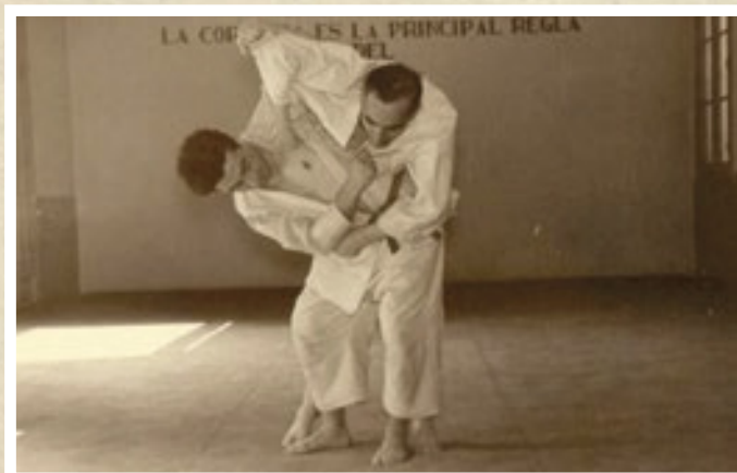
En la foto puede apreciarse la amplitud de la lona del Tatami.

Otro problema fue la necesidad de encontrar viruta de madera en grandes cantidades para el relleno del Ta-