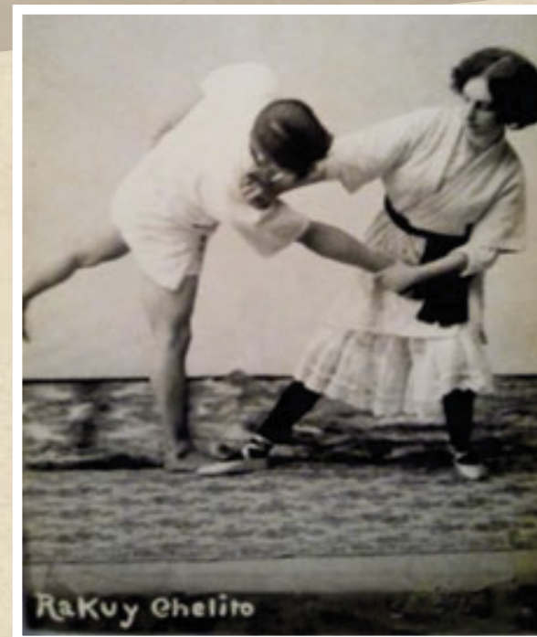
Año 1907: Demostración de cómo el Judo y el Jiu Jitsu podían ser útiles tanto para el sexo masculino como para el femenino.